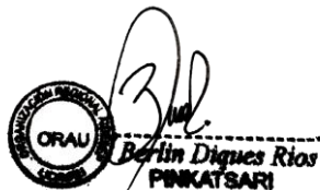
Berlín Diques Presidente de ORAU